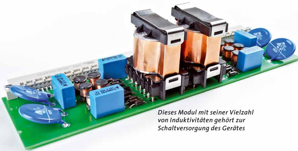
Dieses Modul mit seiner Vielzahl von Induktivitäten gehört zur Schaltversorgung des Gerätes