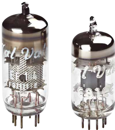
Mit eigenem Stempel: Im head amp three steuern E81CC und EF184 die Endstufe an

tostatische Kopfhörer betrieben werden. Sind Elektrostaten gefragt, darf der Hochspannungsausgang des Gerätes ohne Umweg aktiv werden; Elektrostaten brauchen hohe Spannungen zum Betrieb, die normalerweise vom serienmäßigen Speiseteil des Kopfhörers bereitgestellt werden. Die Ausgangsübertrager haben zwei Sekundärwicklungen, die sich entweder in Reihe oder parallel betreiben lassen; Ersteres empfiehlt sich für eher hochohmige Kopfhörer, Letzteres für niederohmige – oder für Lautsprecher.