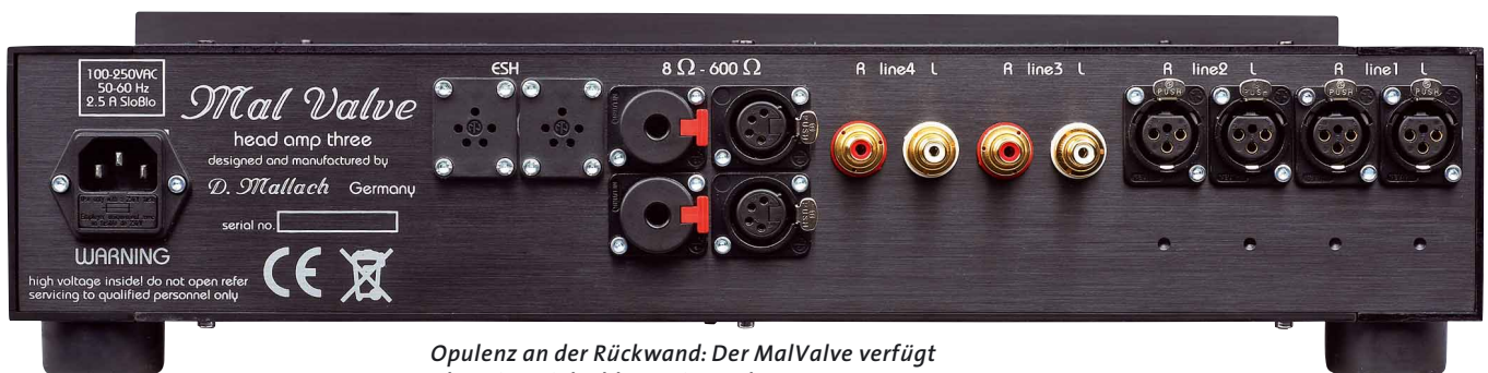
Opulenz an der Rückwand: Der MalValve verfügt über eine Vielzahl von Ein- und Ausgängen

Als Erstes durfte wieder einmal Bill Henderson und sein wunderschönes „Send in the Clowns“ auf den Plattenteller. Der 45er-